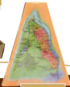
Étui Médoc de Noisettes