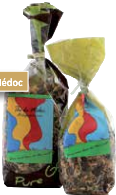
Thé du Médoc